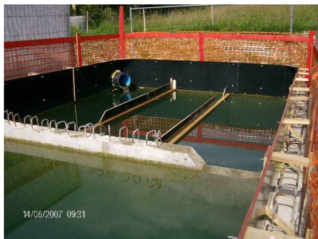
Bac de décantation en sortie du tunnel de Mornay