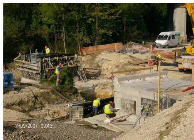
Elargissement et création d'ouvrage