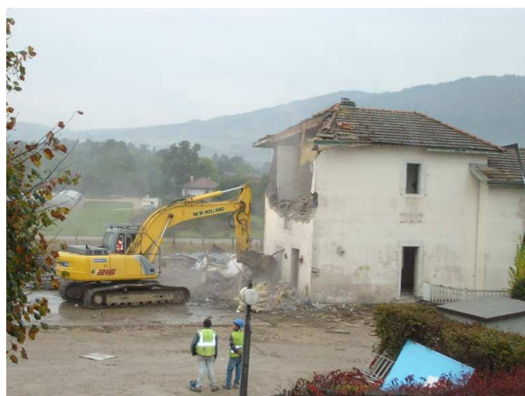
Démolition de la gare le 9 octobre 2008