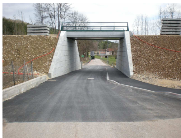
CD 11 après travaux