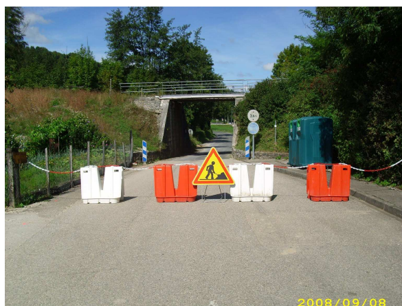
CD 11 avant travaux